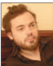
* Γράφει ο συγγραφέας Θοδωρής Καραγεωργίου www.karageorgiou.blogspot.com

Κριτική για το «Fight Club» που διακρίνεται για τη ρεαλιστική του απόδοση