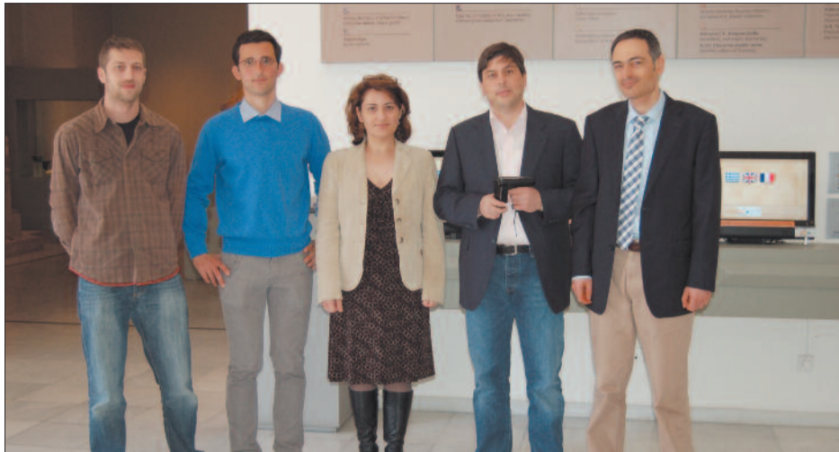
Μέλη της ερευνητικής ομάδας ποζάρουν με φόντο το έργο τους

Η έγκριση του προγράμματος αποτελεί μία επιτυχία του Κ.Ε.Τ.Ε.Α.Θ. και των συνεργαζόμενων φορέων, καθώς έγινε σε πολύ ανταγωνιστικά πλαίσια. Συγκεκριμένα, το 2008, κατόπιν α-